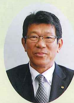
西都市長 押川 修一郎