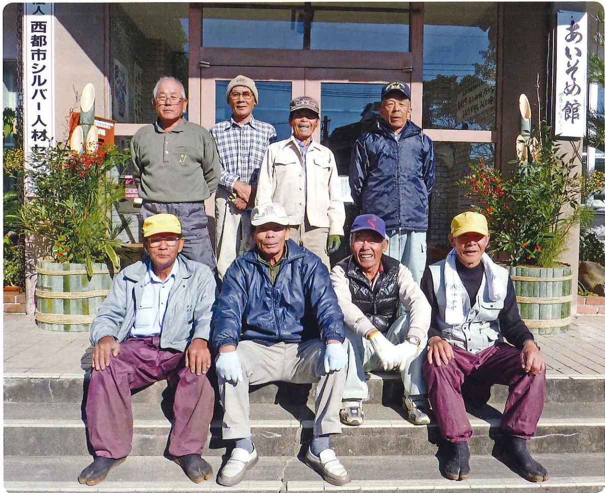
※門松を作成された会員有志