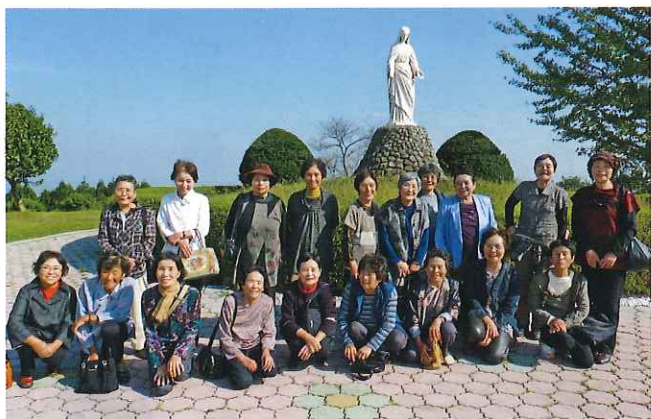
トラピスト修道院(大分県)

足早い忘年会となったのではな いかと思います。 いよいよ仕事の始まりとな りますが、互いに身体を充分注 意し、事故のないシルバーセン ターづくりに努力したいもので す。ありがとうございました。