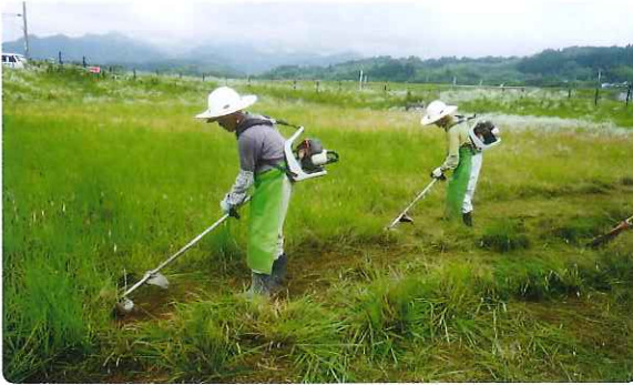
例としてモデルになって頂きました。